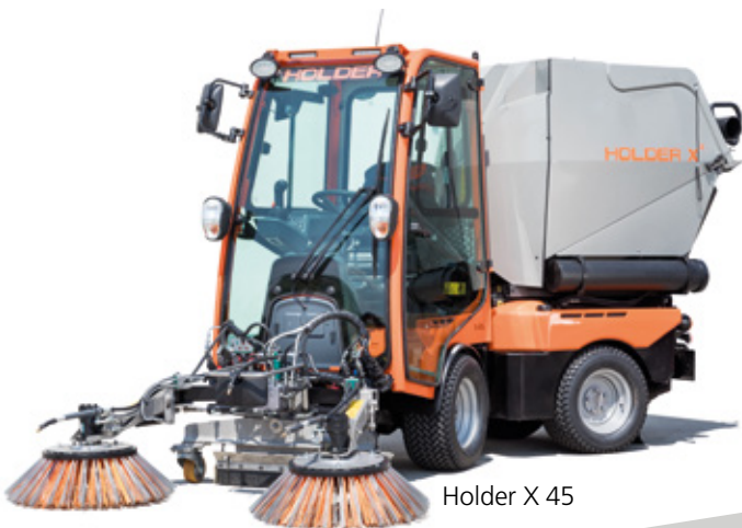
Holder X 45